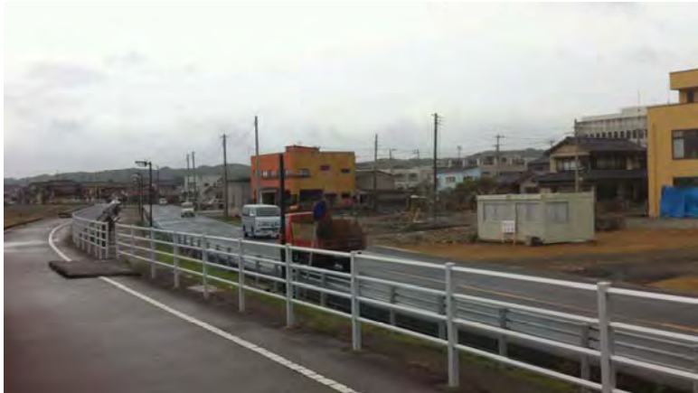
2011年5月7日の状況（浜側）