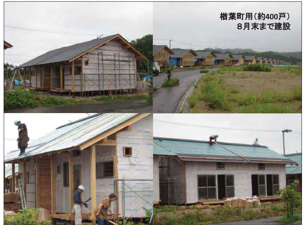
楢葉町用(約400戸) 8月末まで建設