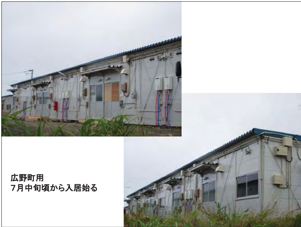
広野町用 7月中旬頃から入居始る